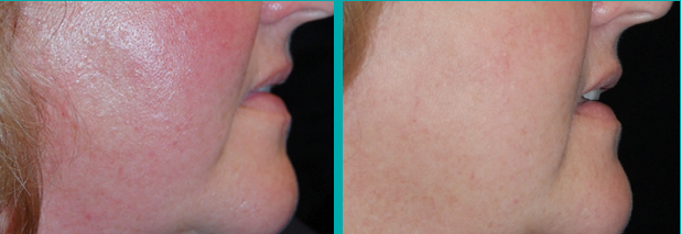
Antes Después de 1 Tto.