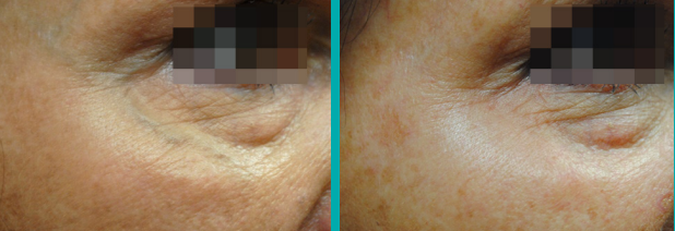
Antes Después de 1 Tto.