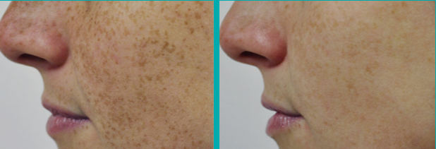
Antes Después de 1 Tto.