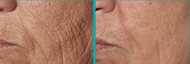
Antes Después de 1 Tto.