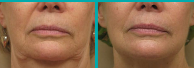
Antes Después de 1 Tto.